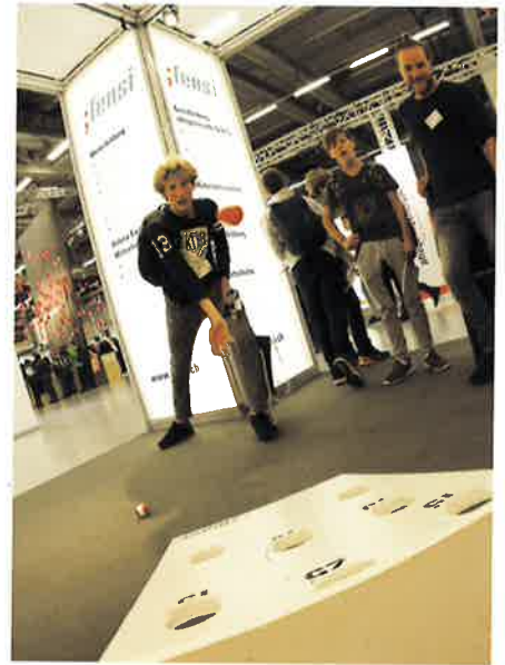
Beim Wurfspiel am Feusi Messestand

Vom 8.–12. September 2017 findet die nächste BAM statt. Selbstverständlich wieder mit der Feusi.